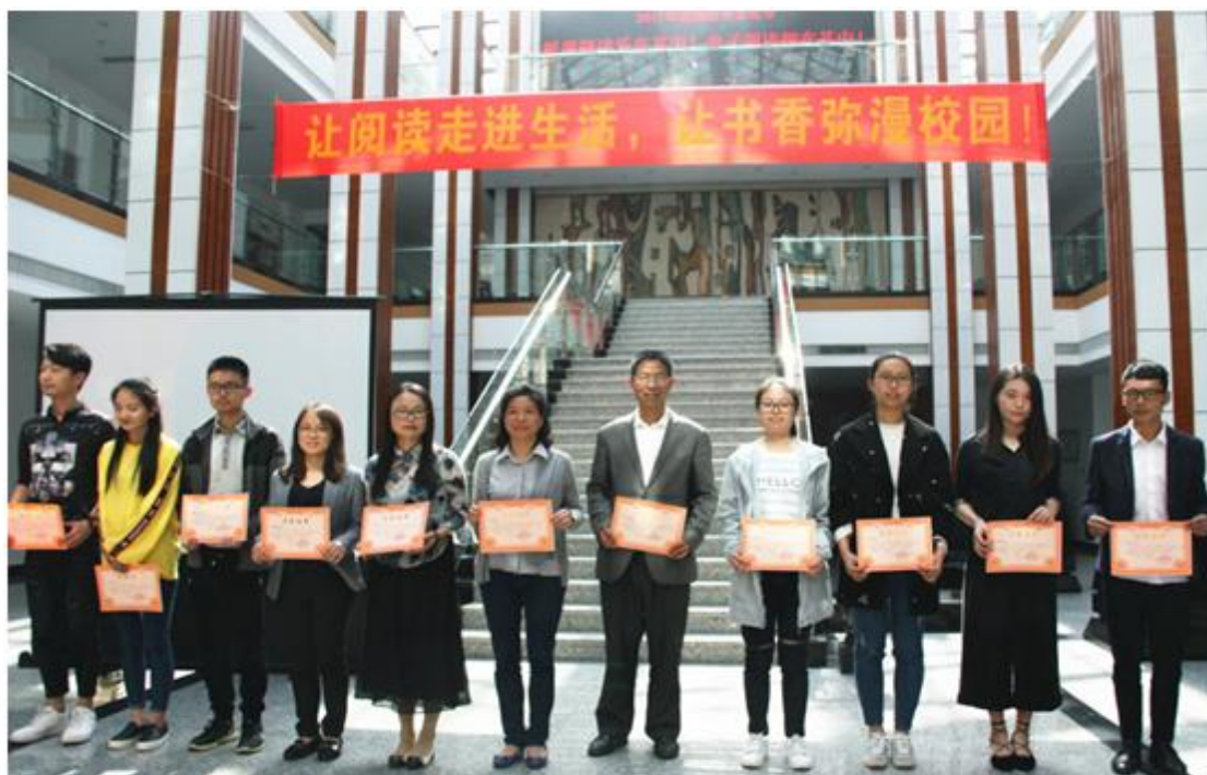
2016 年度优秀读者颁奖