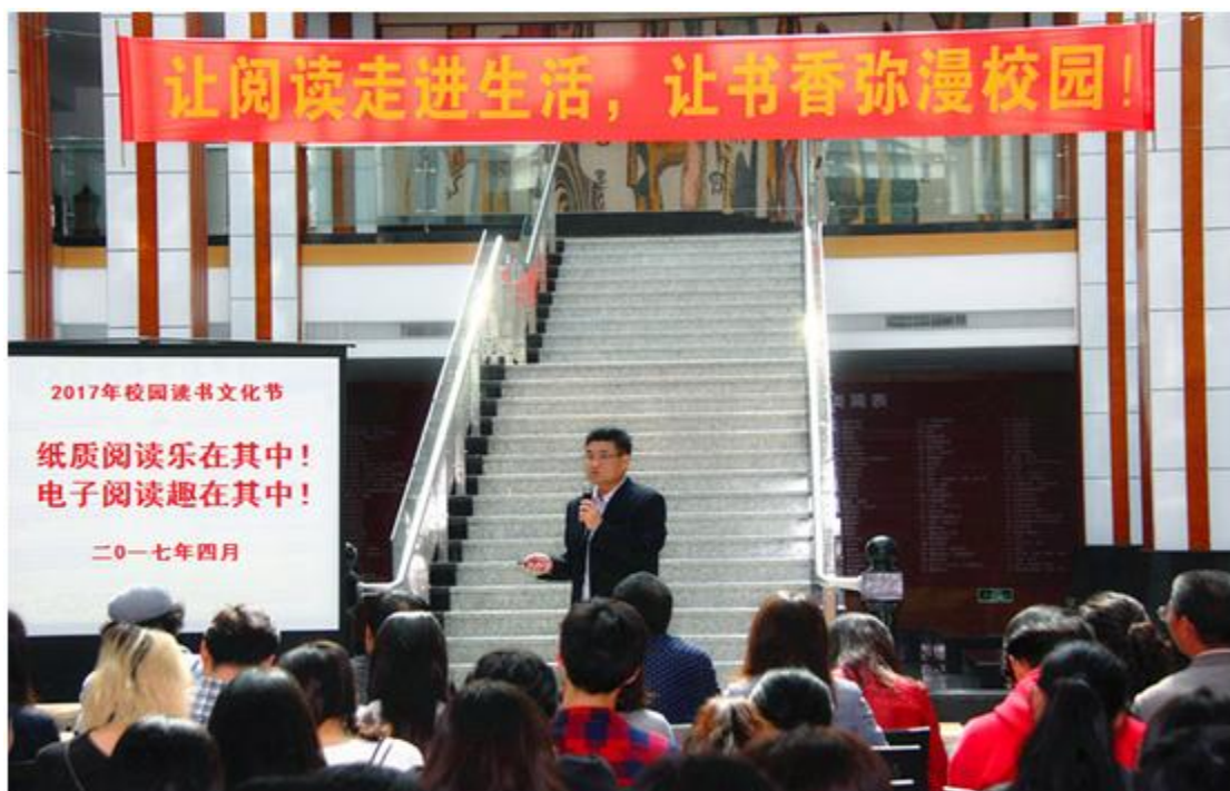
邵馆长介绍活动内容及电子资源情况